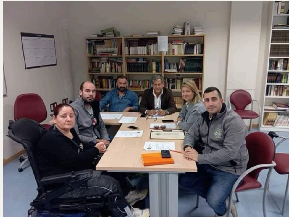
Organización de Papanoelada