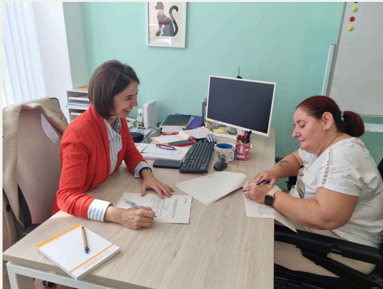
Coordinación con Neurobase