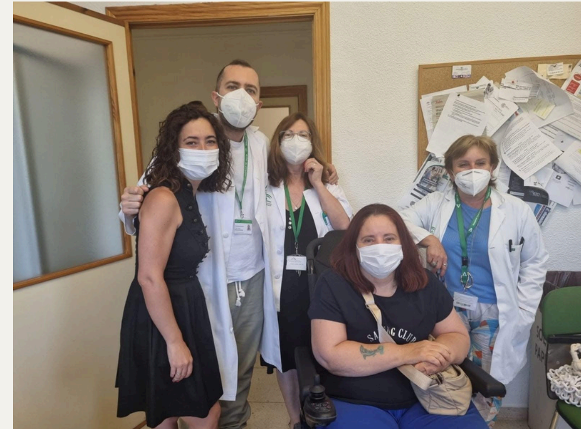
Visita a todos los centros de salud de Jaén