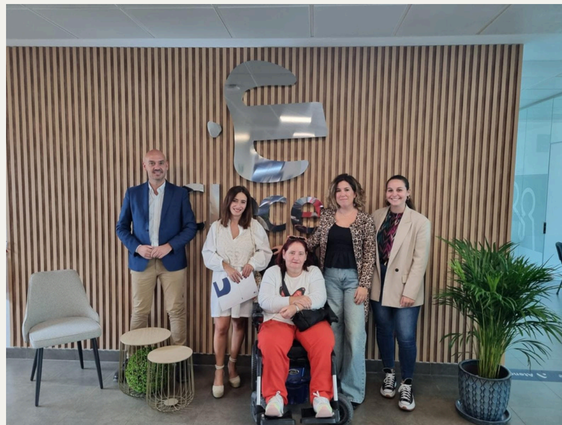
Convenio con Clece