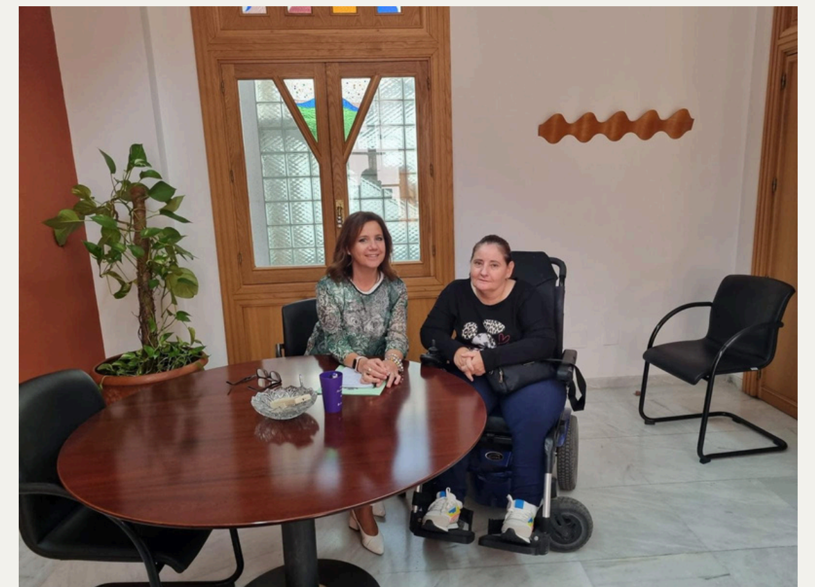
Reunión con Patronato Municipal de Asuntos Sociales