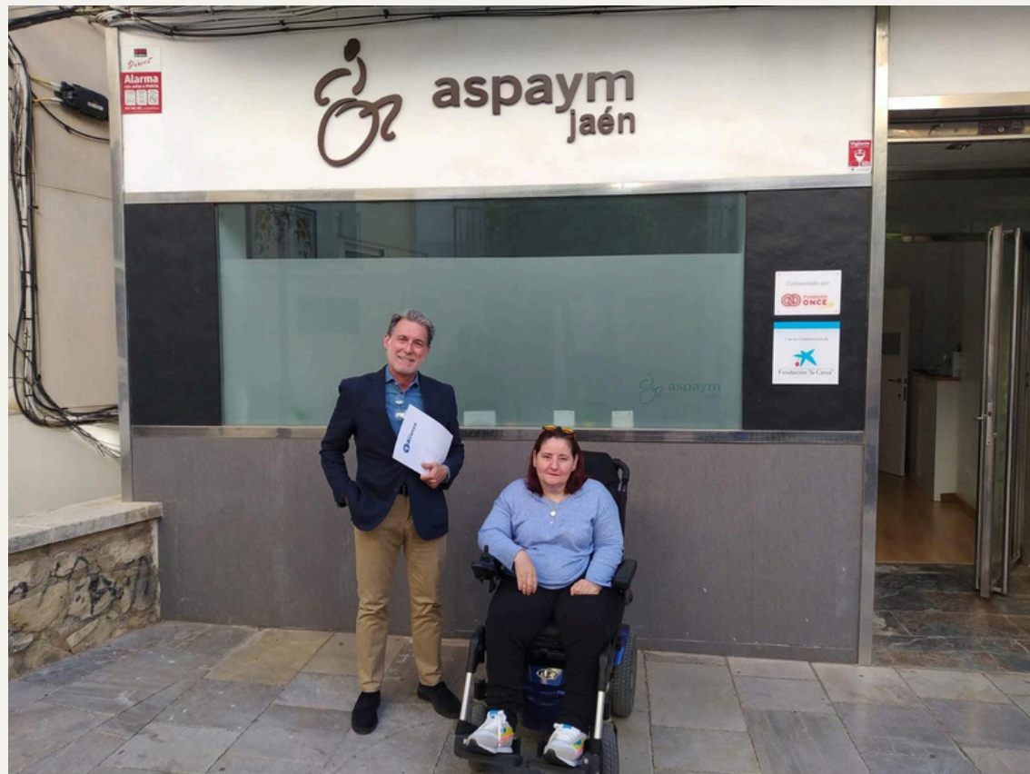
Convenio de colaboración con Grupo Avanza