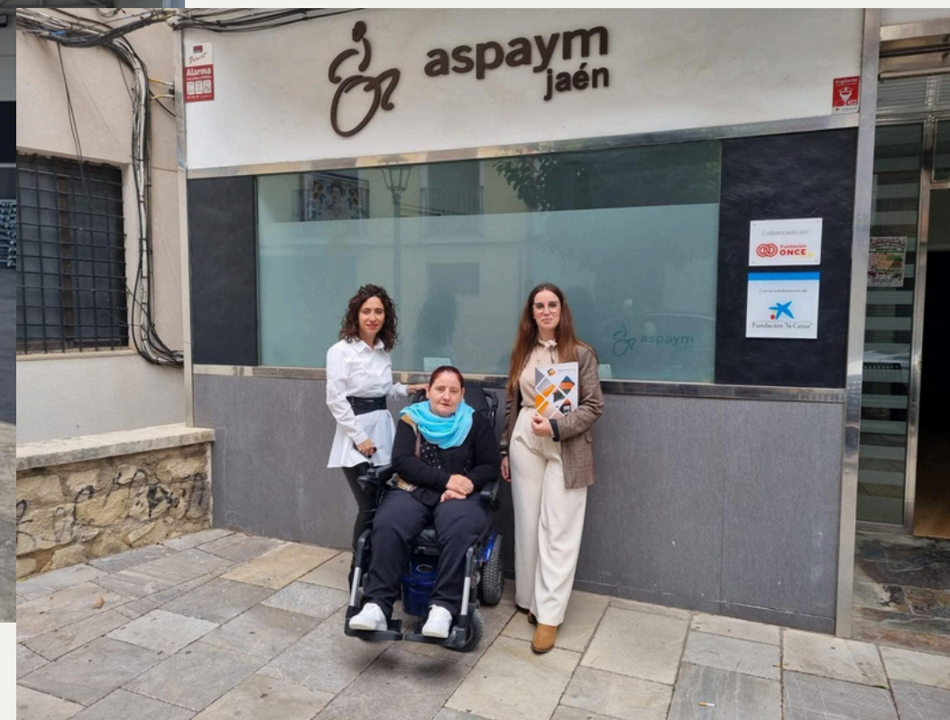
Convenio con Tromans Live S.L.